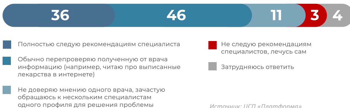
Рис. 4. Выберите из приведенных ниже утверждений то, которое в большей степени описывает ваше отношение к врачебным предписаниям (% опрошенных, один ответ)

К предписаниям врачей россияне относятся с некоторым подозрением: 46% ищут дополнительную информацию, 11% предпочитают обращаться к нескольким специалистам для сравнения разных позиций, и только 36% полностью следуют рекомендациям после приема. Мужчины чаще доверяют мнению одного специалиста (42% против 30% среди женщин).