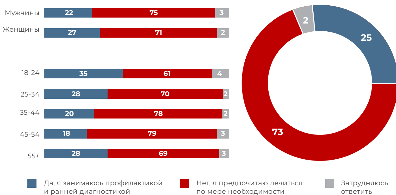
Рис. 2. Склонны ли вы придерживаться профилактических мер и посещать врача при отсутствии симптомов? (% опрошенных, один ответ)

Превентивная забота о здоровье чуть более распространена среди женщин (27% против 22% среди мужчин). На профилактику чаще настроена молодежь в возрасте 18-24 лет (35%), реже всего к ней прибегают люди среднего возраста (18% среди 45-54 лет).