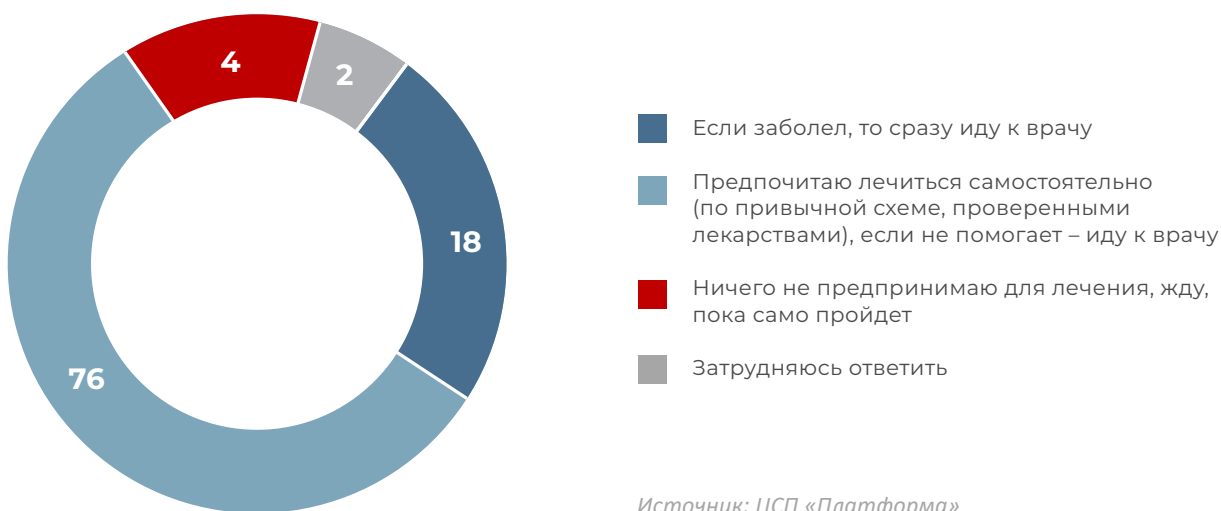
Рис. 3. К какому поведению вы склонны в случае болезни? (% опрошенных, один ответ)