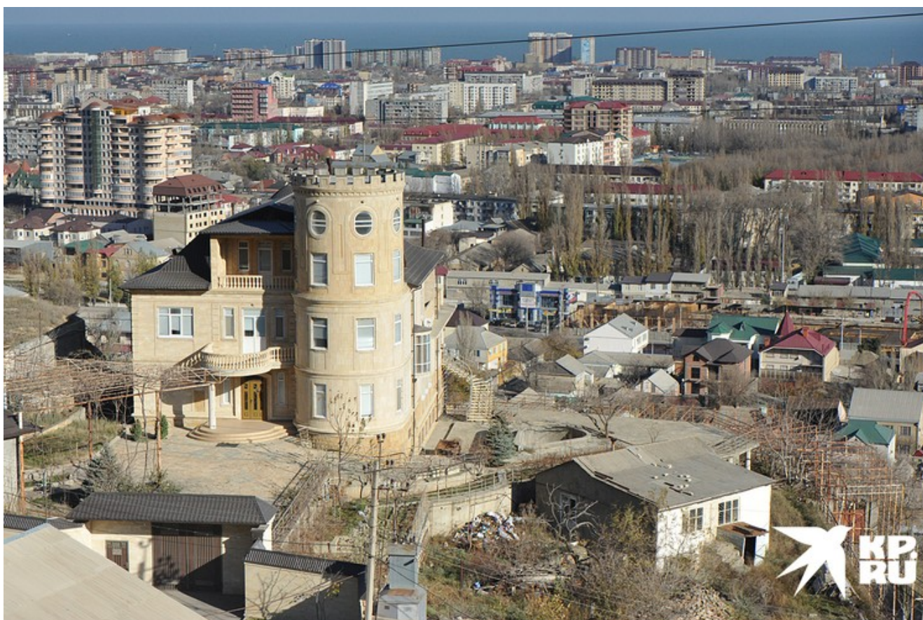
Наверняка миллионником станет Махачкала

– Если население Северного Кавказа продолжит расти, то через несколько десятилетий многие поселки в южных республиках могут вырасти до размера городов, – полагает Владимир Климанов.