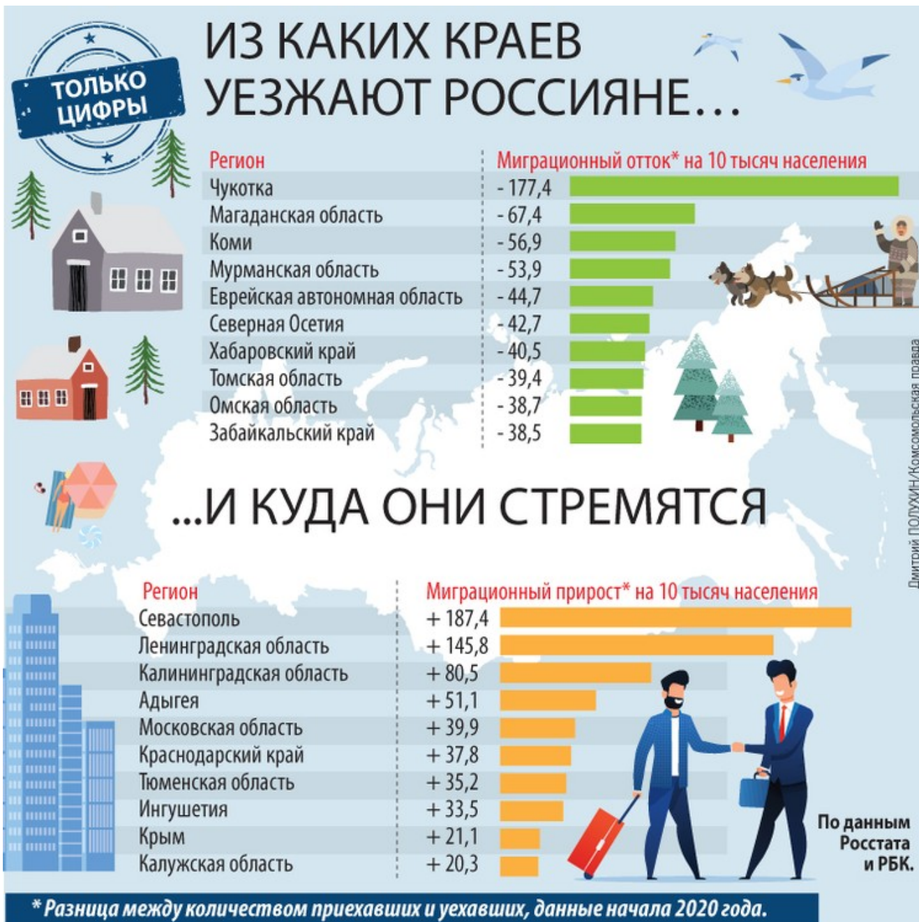
Фото: Дмитрий ПОЛУХИН