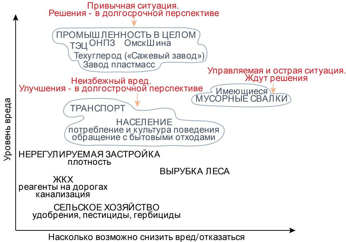
Карта воспринимаемых источников вреда

(по вертикали – уровень вреда по оценкам населения; по горизонтали – представления о том, насколько ситуация управляема, возможно ли минимизировать вред или отказаться от вызывающего вред фактора)